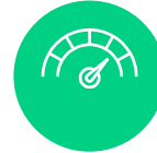
パフォーマンス／アトリビューション分析