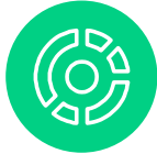
ポートフォリオ管理