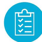
GIPS コンプライアンス