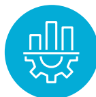
ポストトレード／決済